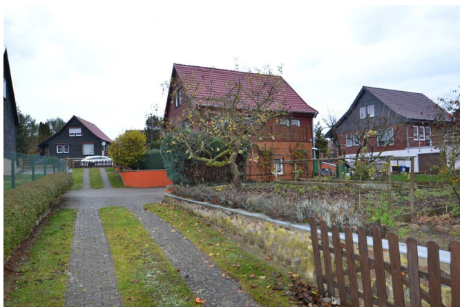
Ansicht vom Hof